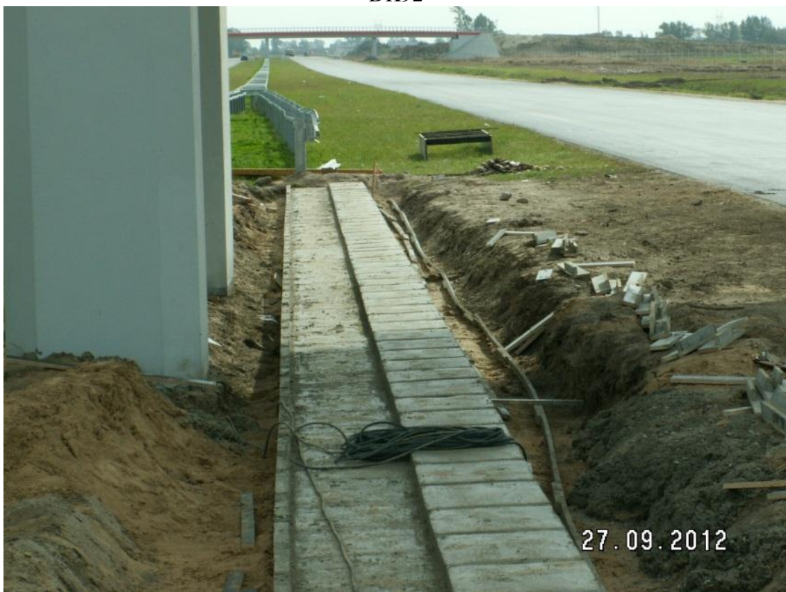
Fundament pod bariery betonowe