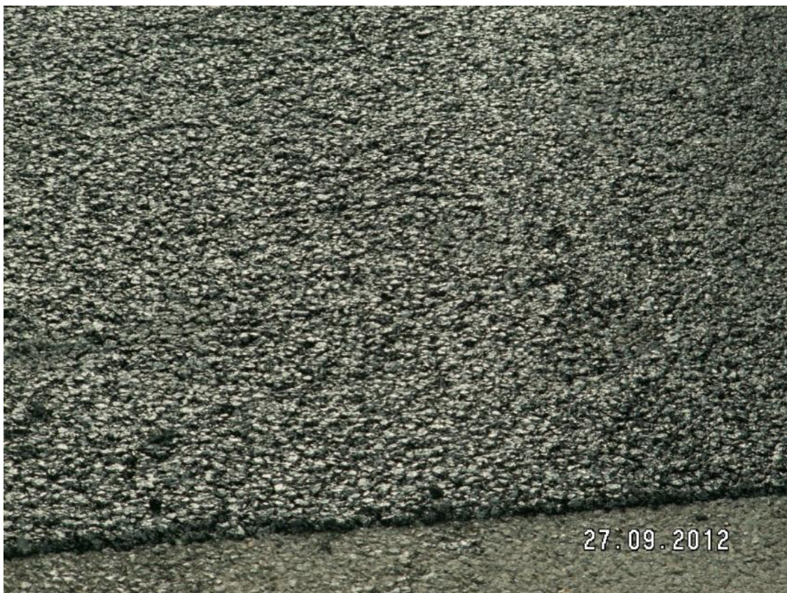
Warstwa ściernalna SMA