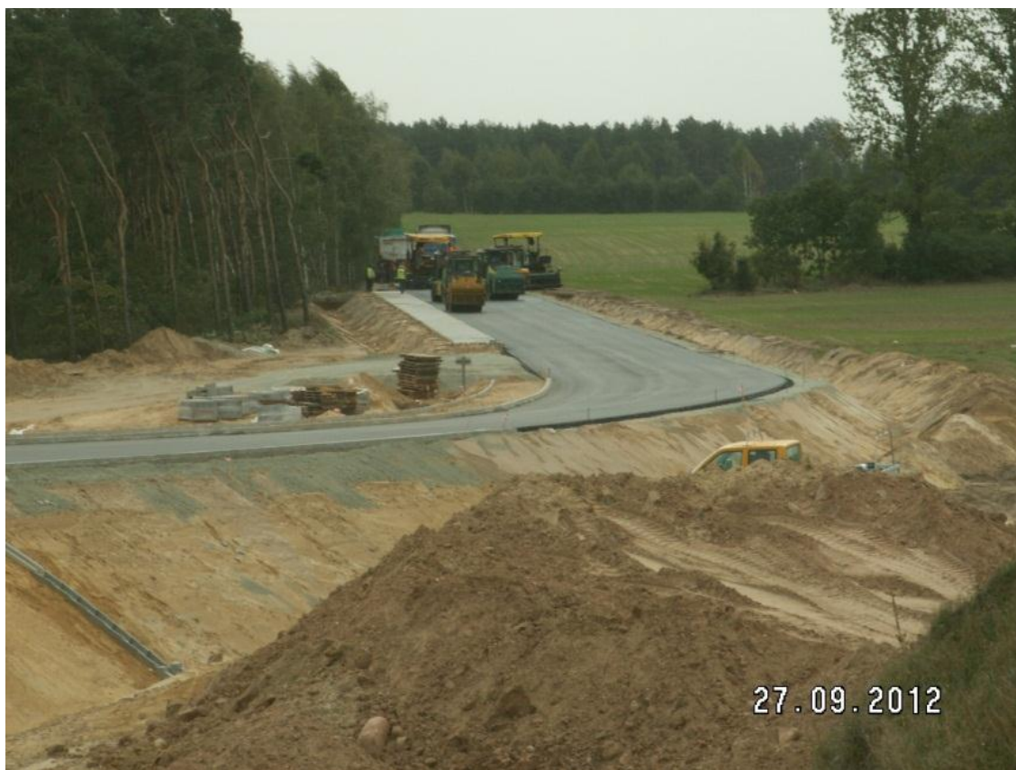
Droga poprzeczna WD213