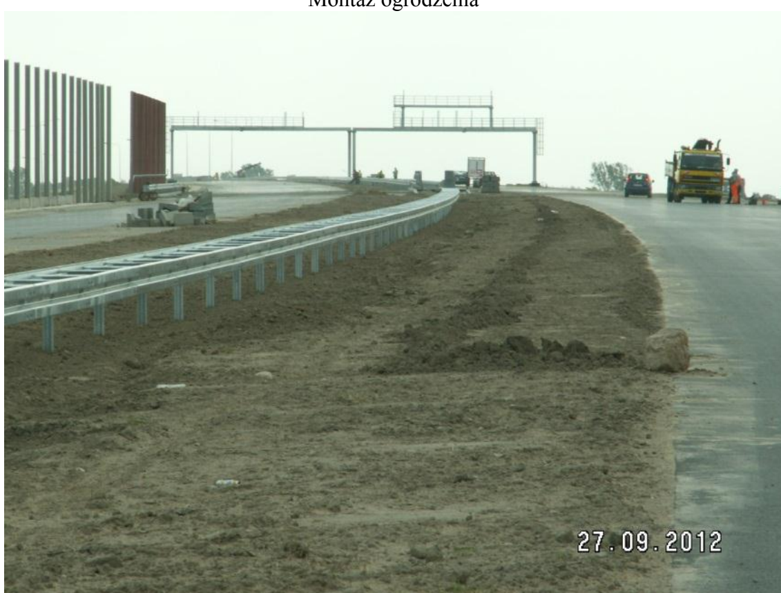
Humusowanie pasa środkowego