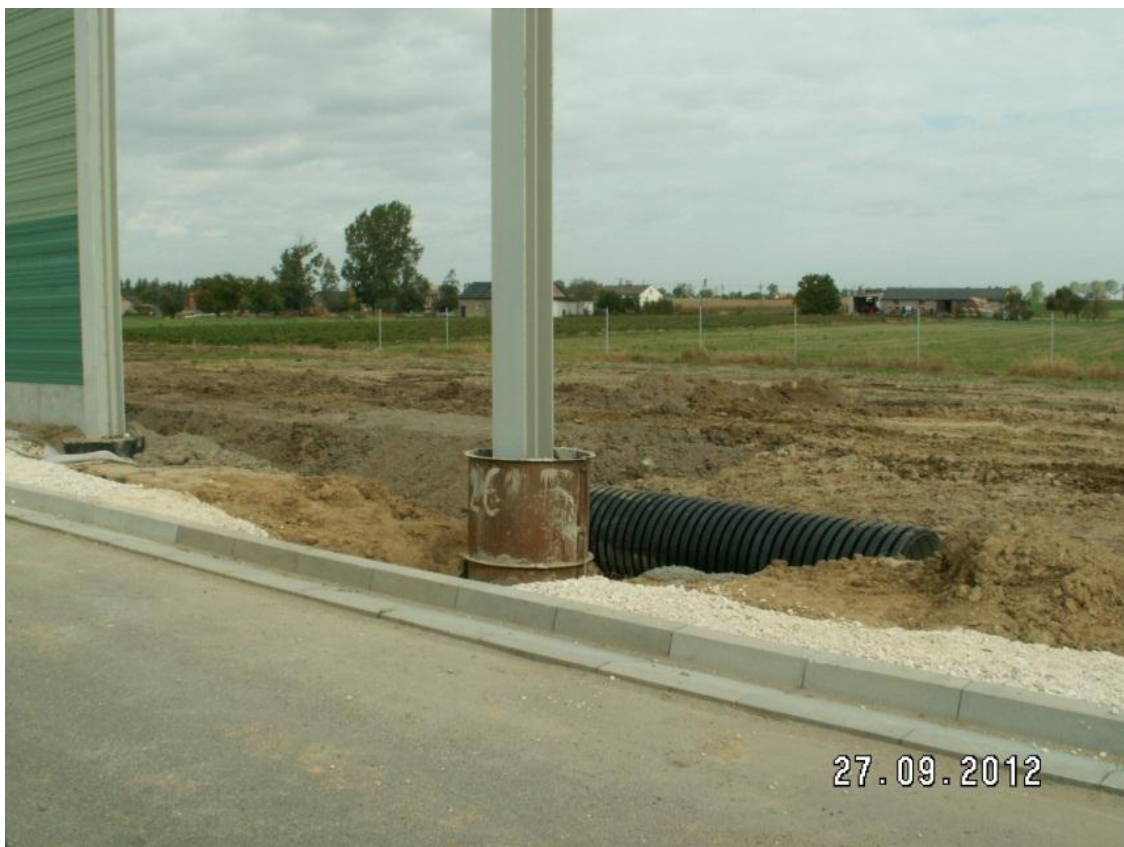
Montaż ekranów akustycznych