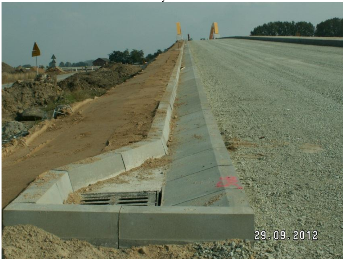
Studnia, ściek, krawężnik WD203