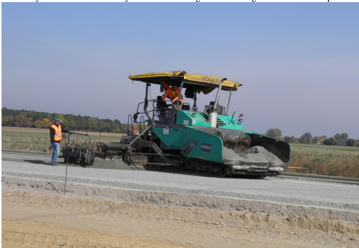
Układanie warstwy podbudowy z kruszywa łamanego stabilizowanego mechanicznie w-waII