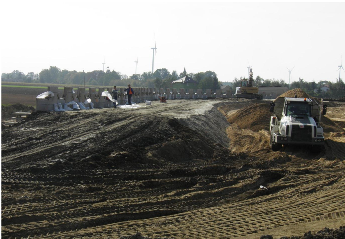
Wykonanie warstwy nasypu z gruntu dowiezionego z dokopuŁącznica BC przy WD 211 Wykonanie zasyпки nasypów zbrojonych wraz z zagęszczeniem.