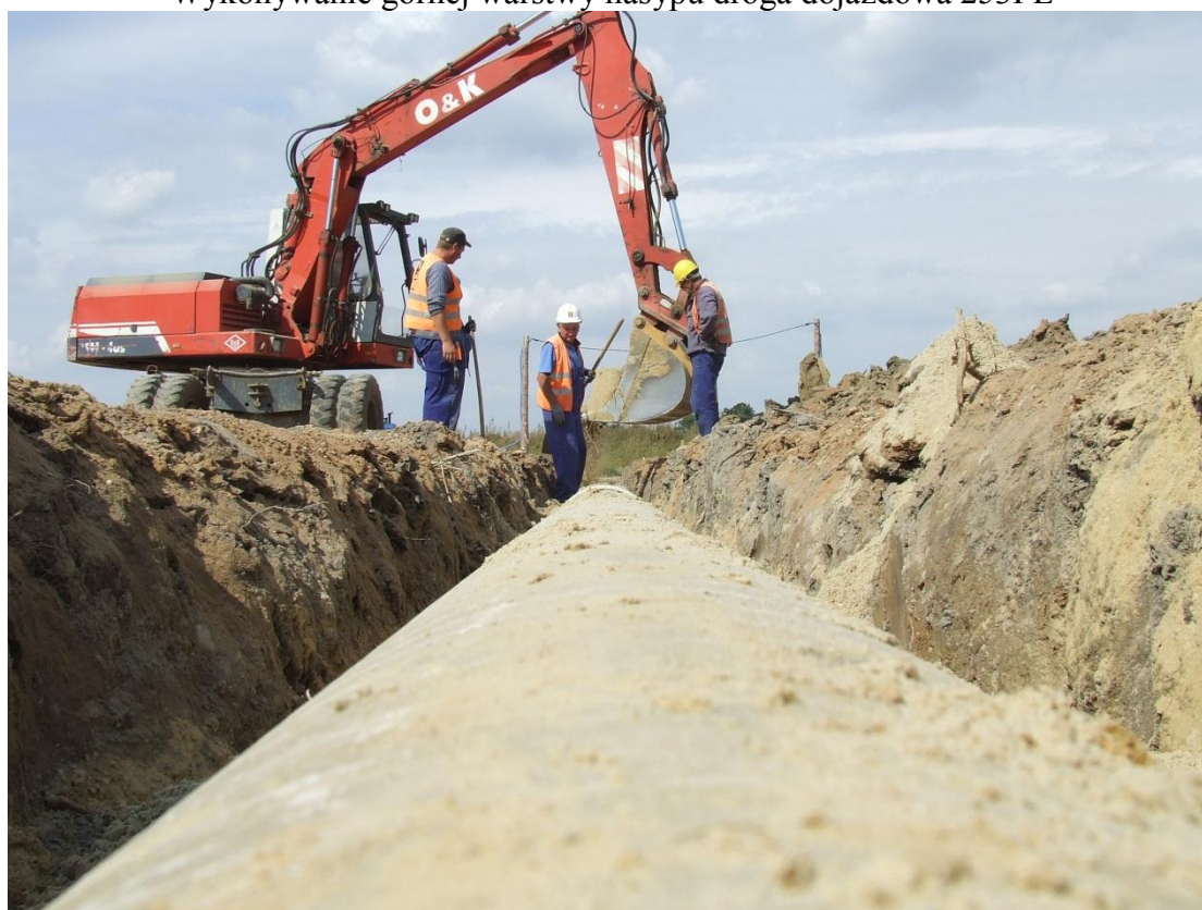
Układanie kanalizacji deszczowej KD 18