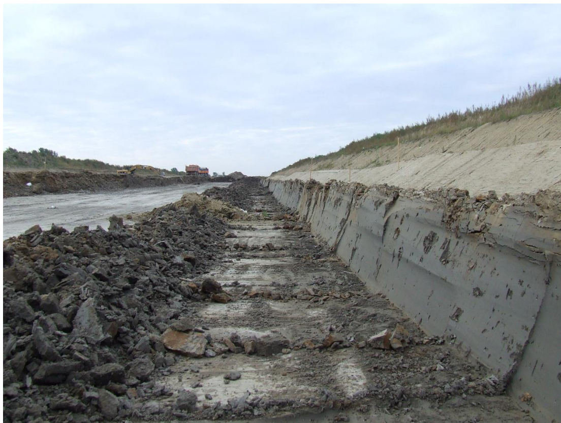
Wykop km 260+800