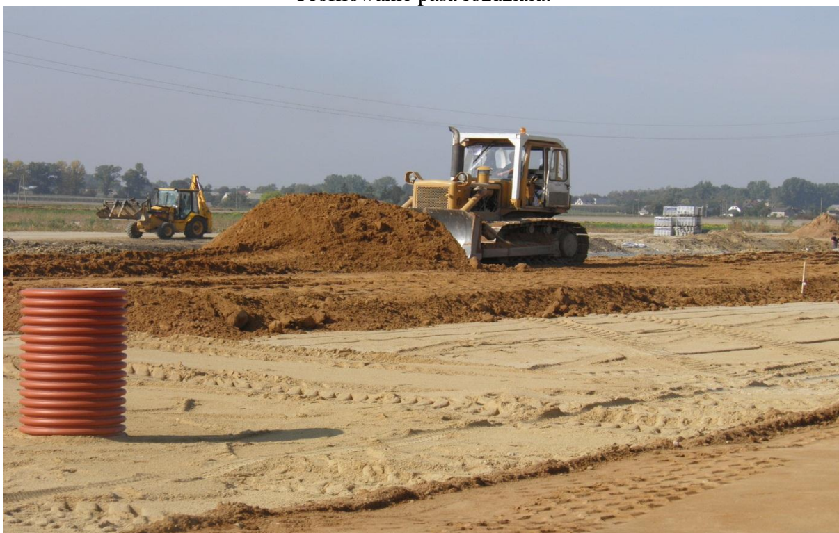
Wykonanie górnej warstwy nasypu-trasa główna.