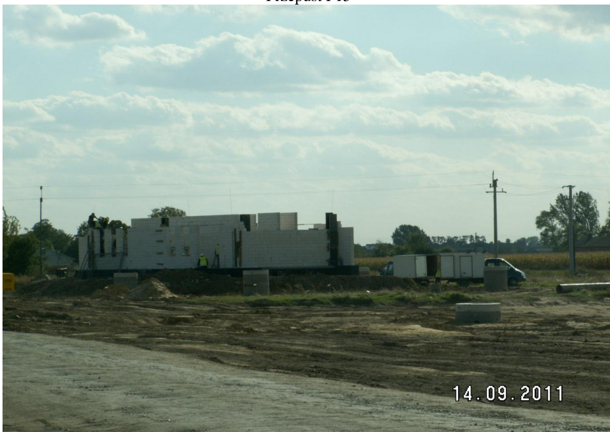
Budowa obiektów małej Architektury MOP Krzyżanów