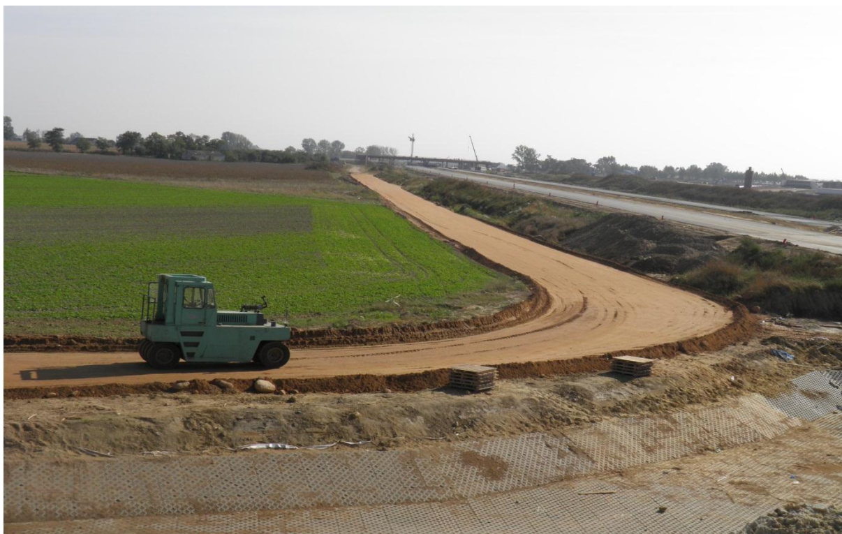
Wykonywanie górnej warstwy nasypu droga dojazdowa 253PL