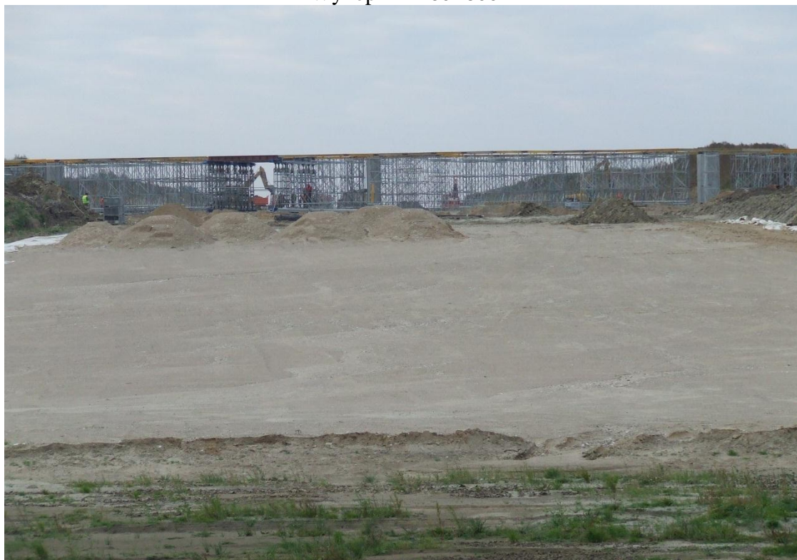
Wykonanie wzmocnienia podłoża pod nasypem przy pomocy geowłókniny i 0,5 warstwy kruszywa naturalnego(materac).