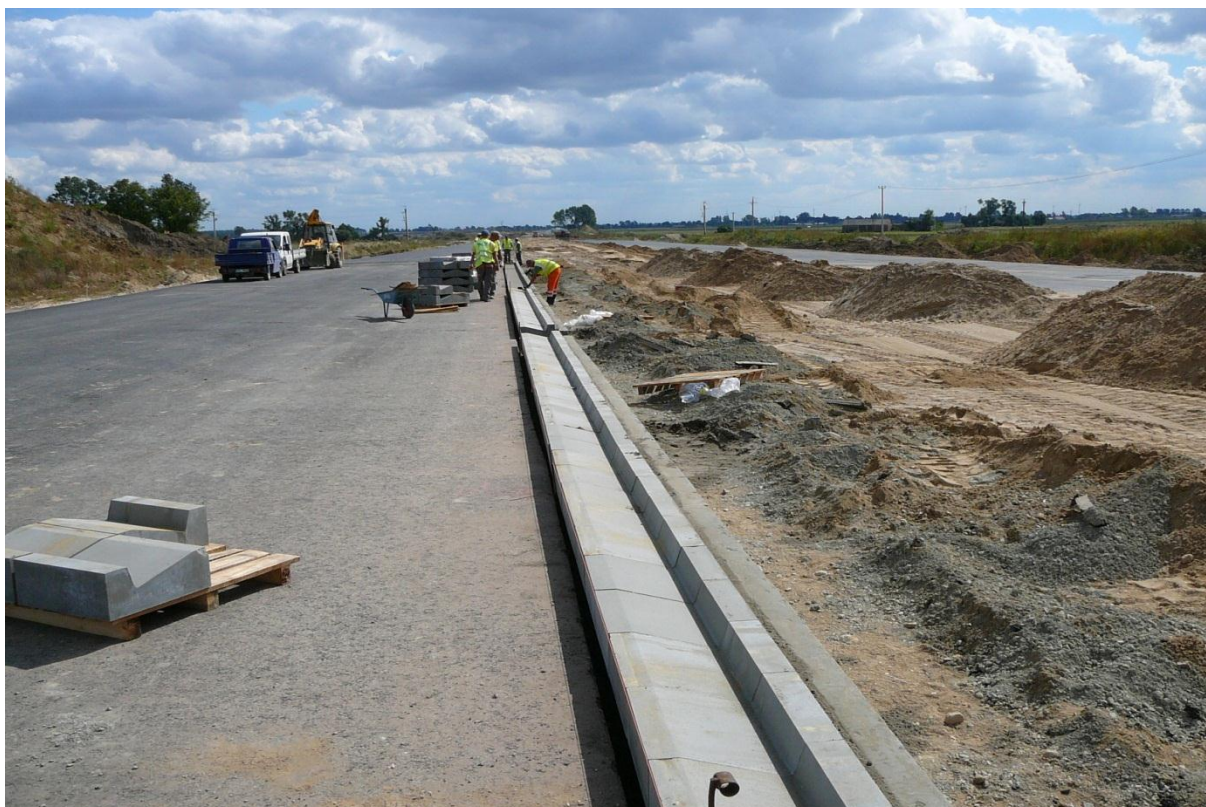
Wykonywanie ścieku ulicznego z prefabrykowanych elementów betonowych trójkątnych.