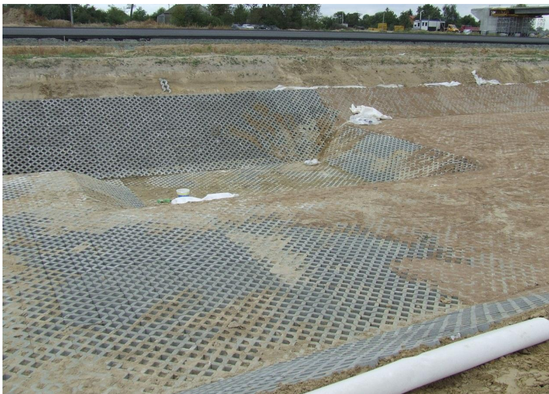
Budowa zbiornika ZB 8.