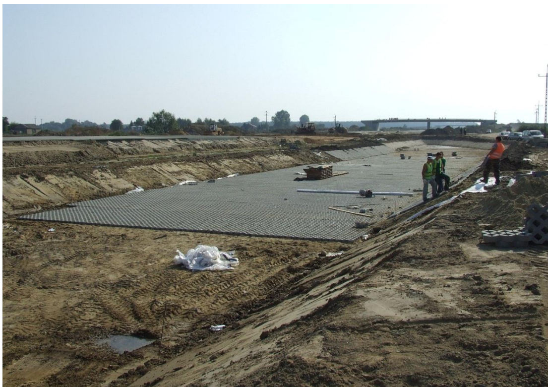
Budowa zbiornika ZB 2