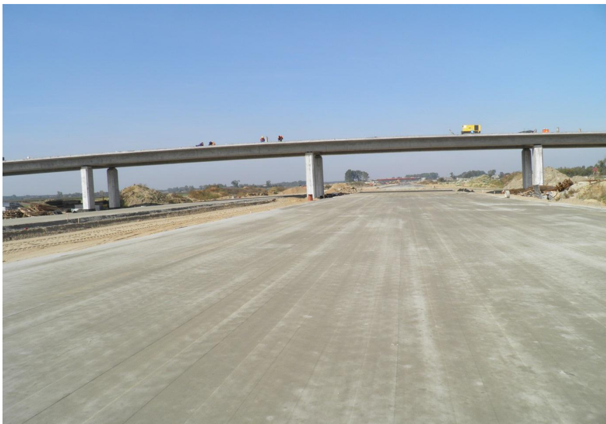
Wykonana warstwa kruszywa stabilizowanego cementem gr 20 cm o R_m=5\text{Mpa}