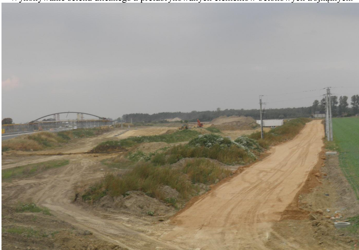
Ułożona górna warstwa nasypana drodze dojazdowej 258LB