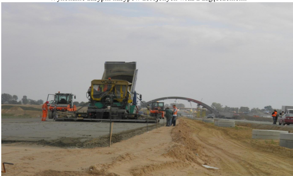
Układanie warstwy kruszywa stabilizowanego cementem gr 20 cm o R_m=5\text{Mpa} km 253+150-253+450