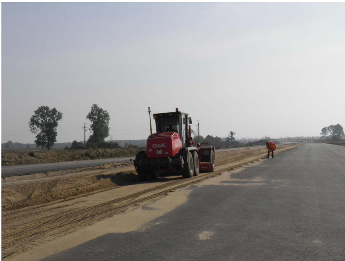
Profilowanie pasa rozdzielającego.