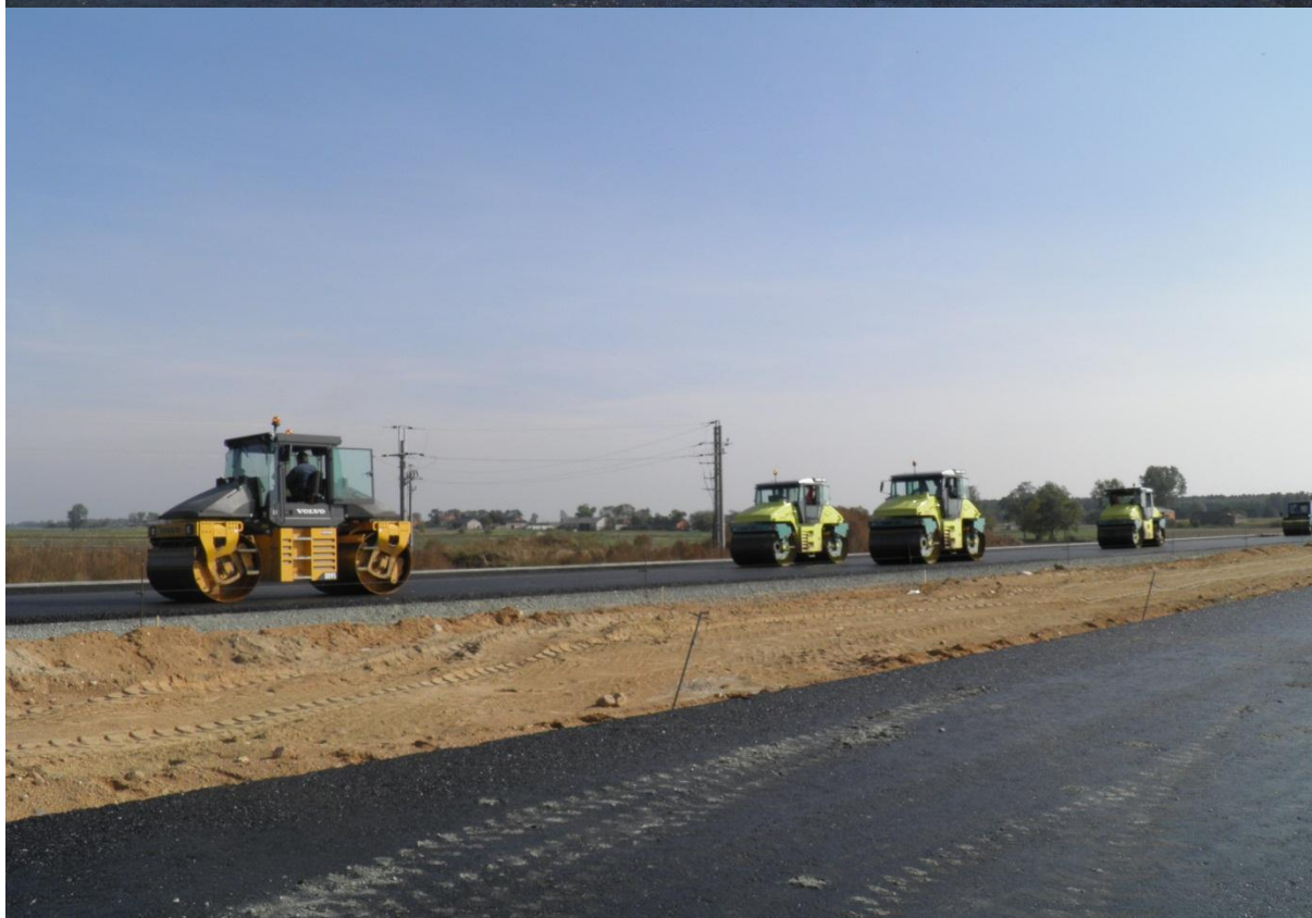
Układanie podbudowy zasadniczej z betonu asfaltowego o wysokim module sztywności gr.17 cm