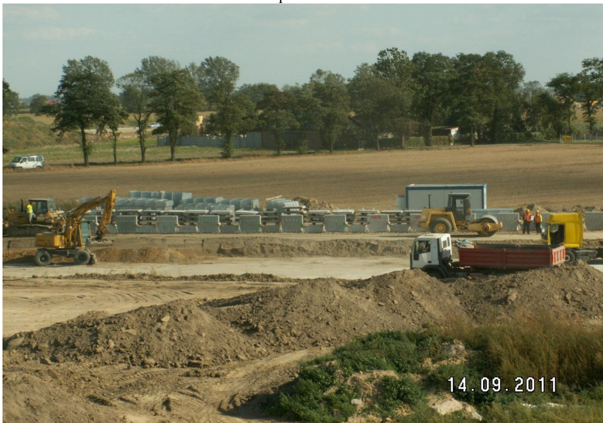
Ściana oporowa WD 211