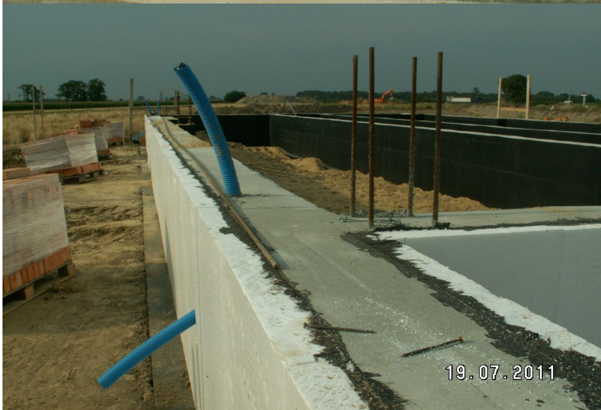
Mała Architektura MOP Krzyżanów