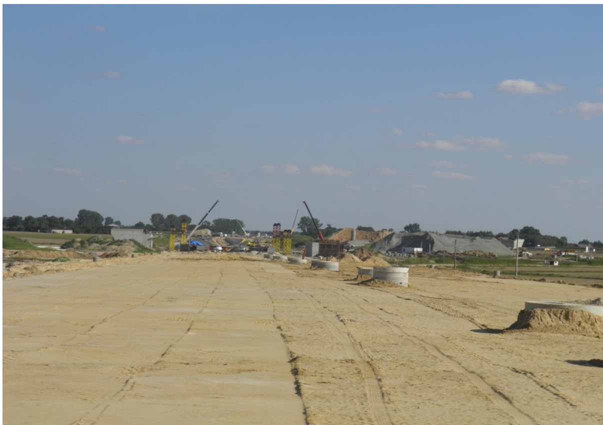
Zamontowane studnie kanalizacji deszczowej na trasie głównej km 253+200