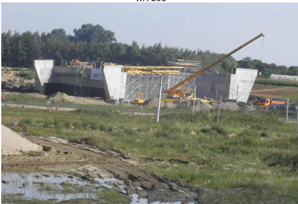
Obiekt WD 211A