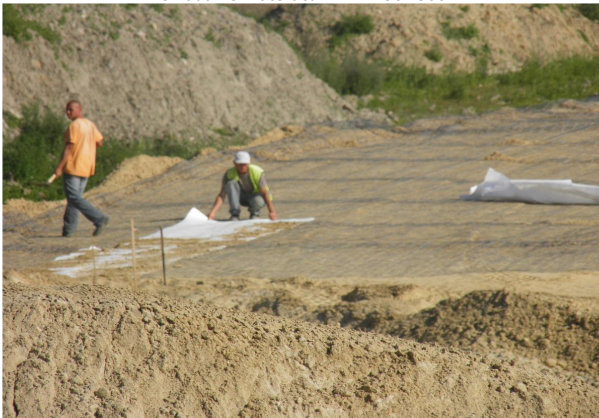
Zbrojenie geosiatką (oraz geowłókniną) skarp wysokich nasypów