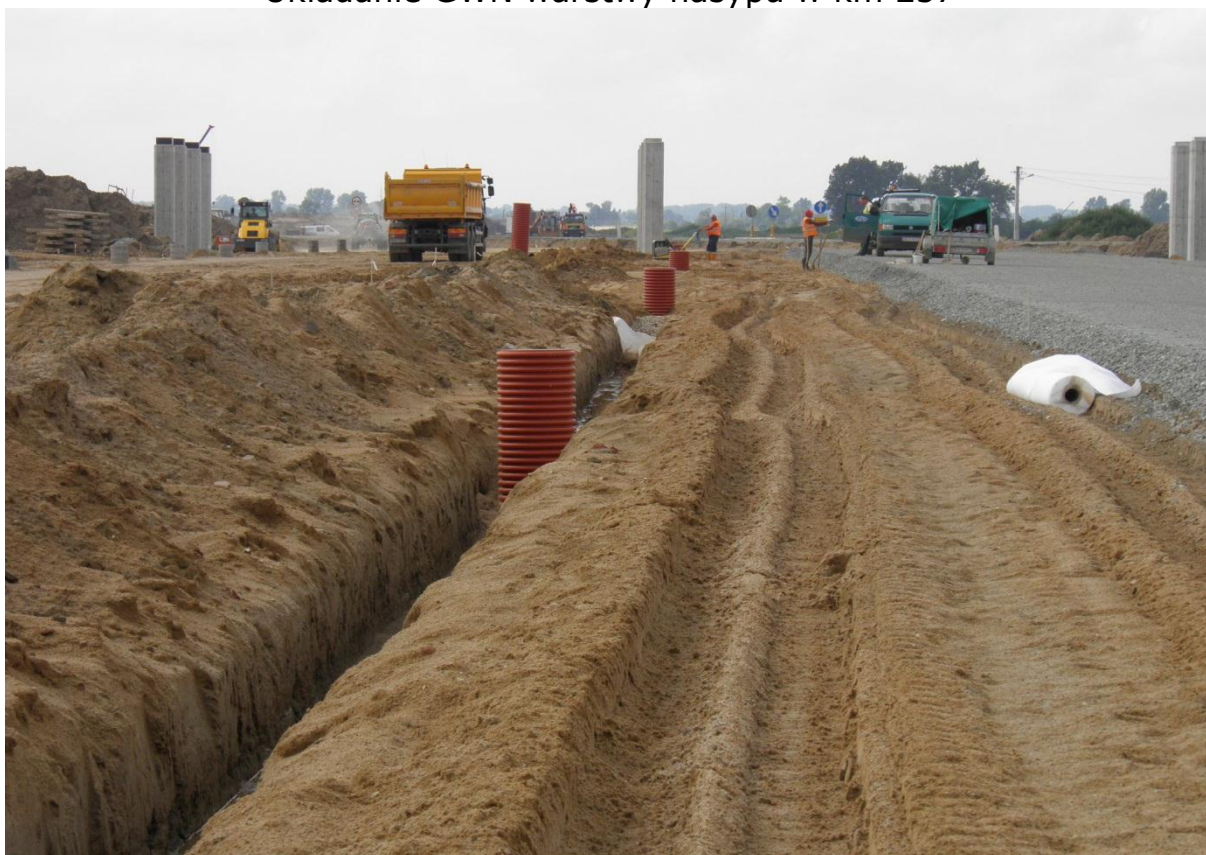
Wykonywanie drenażu drogowego