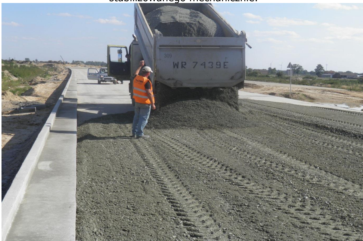
Układanie I-warstwy podbudowy z kruszywa łamanego 0/31,5mm stabilizowanego mechanicznie.