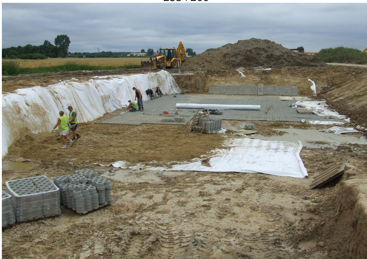
Budowa zbiornika ZB1