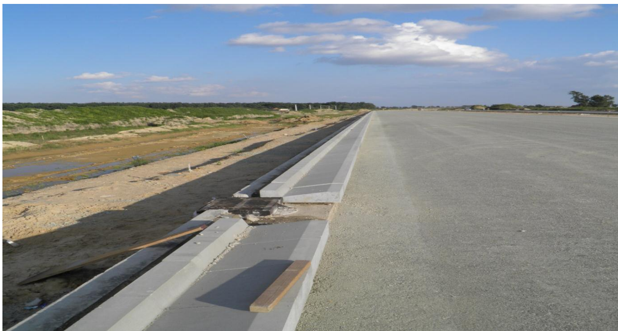
Ułożony ściek trójkątny oraz podbudowa z kruszywa łamanego 0/31,5mm stabilizowanego mechanicznie