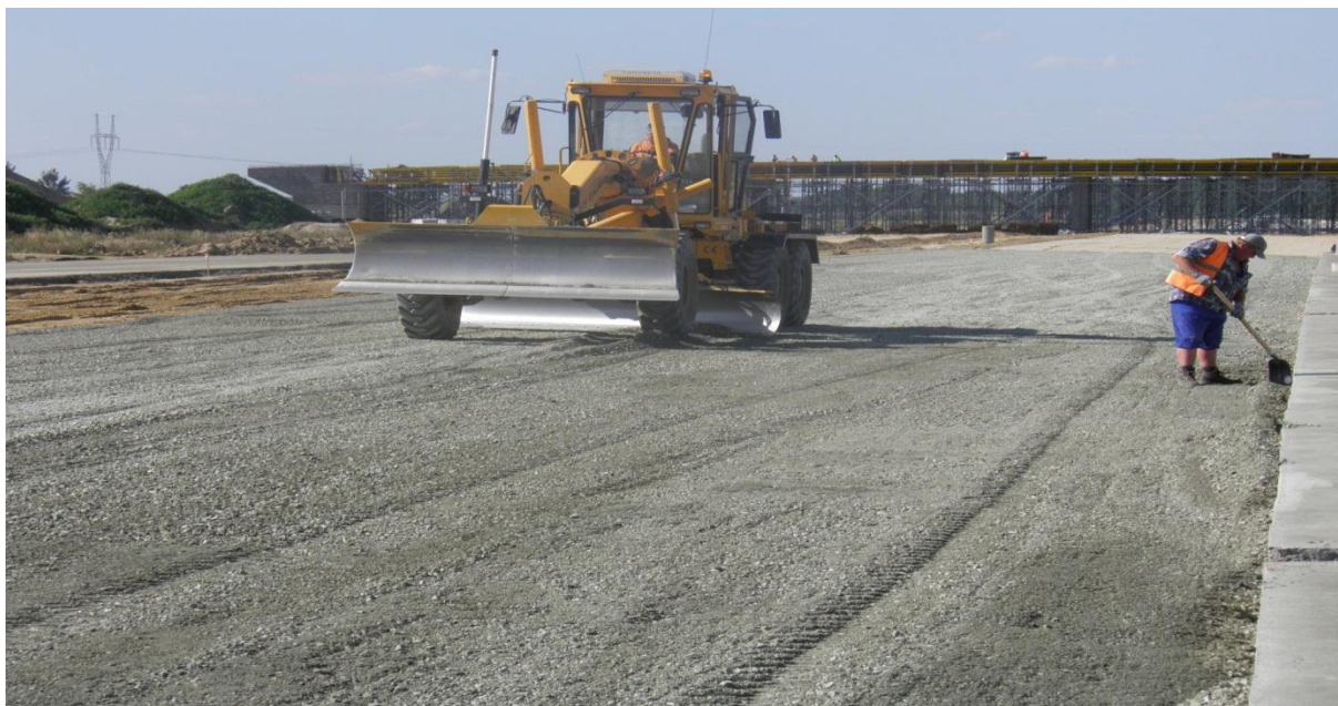
Układanie I-warstwy podbudowy z kruszywa łamanego 0/31,5mm stabilizowanego mechanicznie.