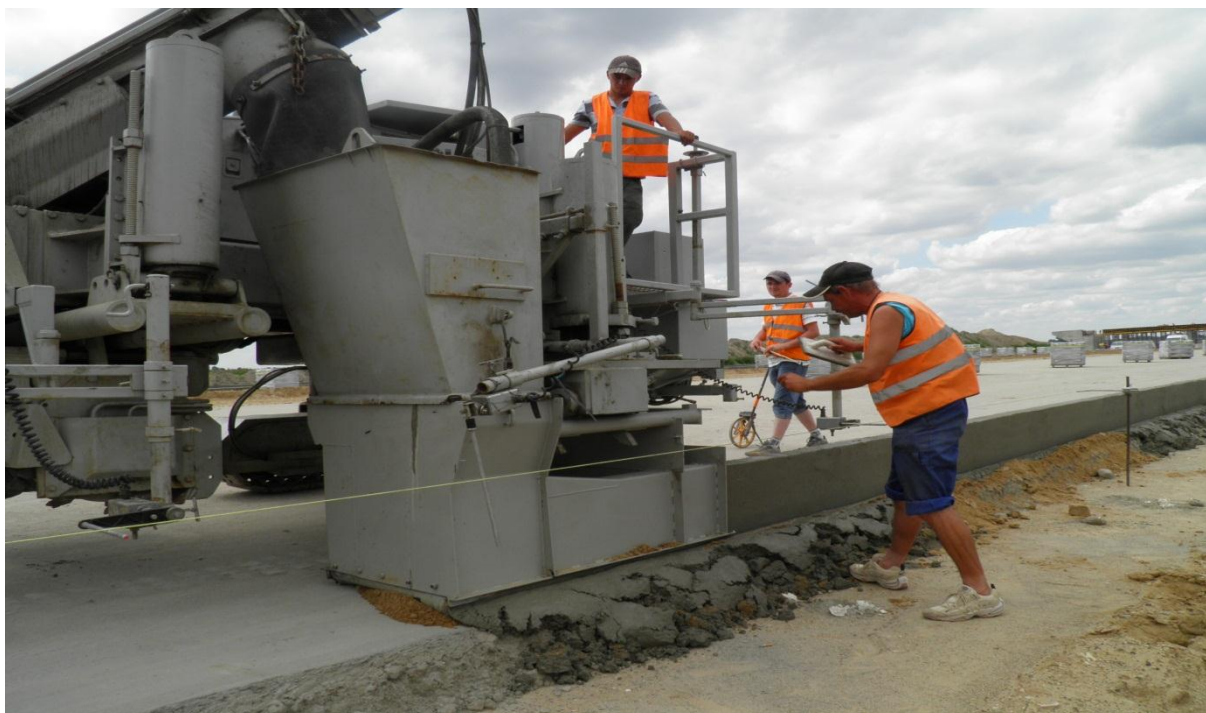
Wykonywanie ławy betonowej pod ściek przykrawężnikowy z elementów betonowych trójkątnych technologią Power Curbers.