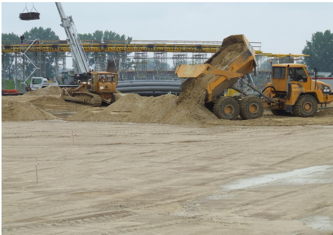
Układanie materaca w km 258+300