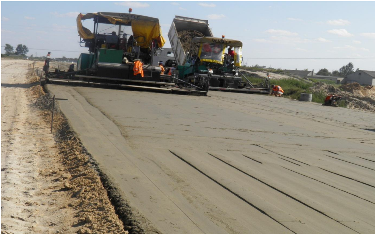
Układanie warstwy kruszywa stabilizowanego cementem o R_m=5\text{Mpa}