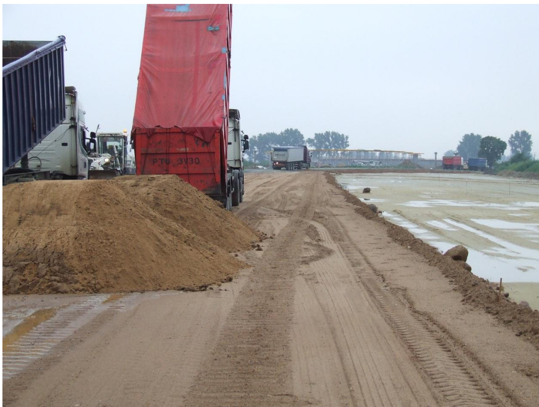
Układanie GWN warstwy nasypu w km 257