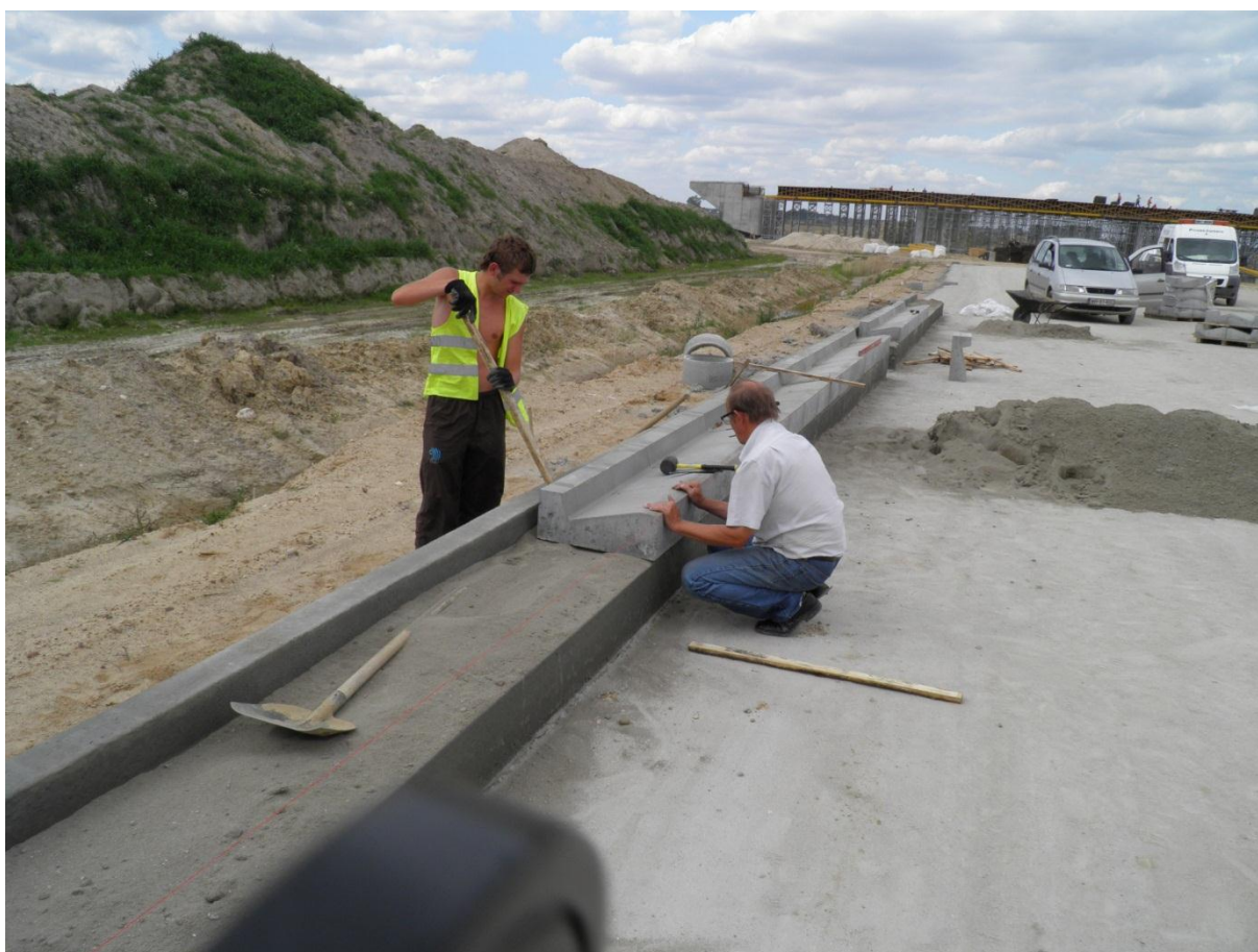
Układanie korytek ściekowych-trójkątnych na podsypce cementowo-piaskowej.