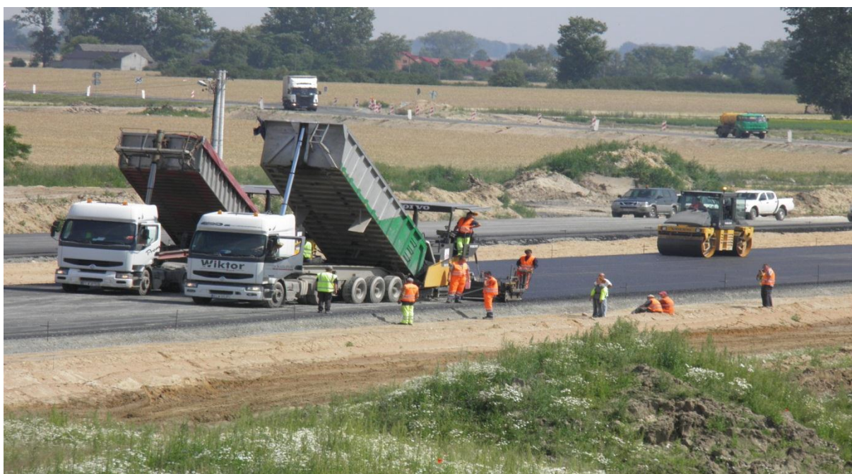
Układanie podbudowy zasadniczej z AC WMS 0/16mm