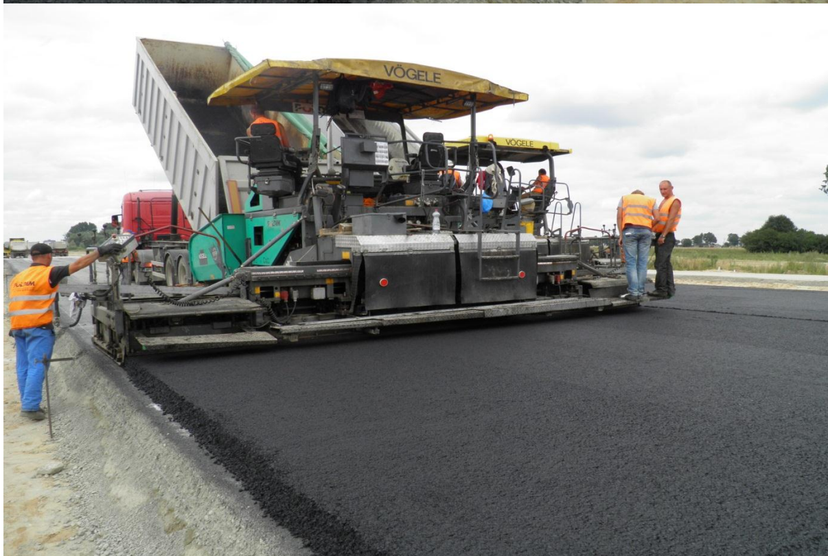
Układanie podbudowy zasadniczej z AC WMS 0/16mm gr. 17 cm