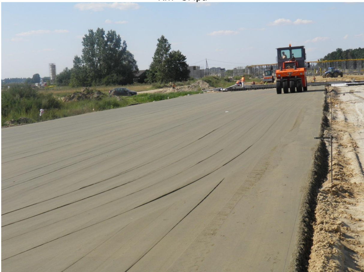
Zagęszczanie warstwy kruszywa stabilizowanego cementem o R_m=5\text{Mpa}